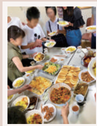
オープンチャーチ

イースターやクリスマスには、セレブレーション(特別礼拝)を行います。子供たちのお楽しみ会「キッズ・フェスティバル」や、みんなで出かける親睦会もあります。ポットラックパーティーなど飲食を伴うイベントは、状況に応じて再開したいです。