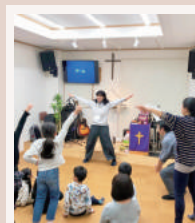
キッズフェスティバル

イースターやクリスマスには、セレブレーション(特別礼拝)を行います。子供たちのお楽しみ会「キッズ・フェスティバル」や、みんなで出かける親睦会もあります。ポットラックパーティーなど飲食を伴うイベントは、状況に応じて再開したいです。